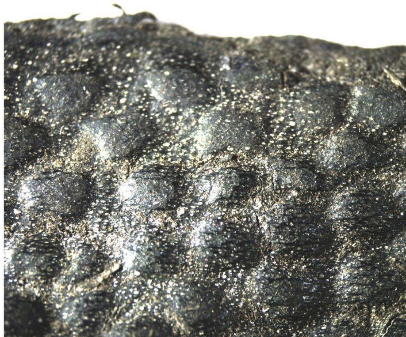
Иллюстрация к статье О. А. Фатюниной «Средневековые изделия из рыбьей кожи в Переяславле Рязанском»: рыба кожа под микроскопом (мерея)

Традиция использования рыбьих кож коренными малочисленными народами хорошо известна по данным этнографии. Как показало исследование археологических материалов второй половины XV века из Переяславля Рязанского, эта технология была известна в Средние века и в Центральной России. При изучении находок из кожи исследователи обнаружили три фрагмента изделий из рыбьей кожи, скорее всего, из семейства осетровых, шипа или стерляди. Ранее такие находки не встречались в средневековых русских городах. Судя по отпечаткам на внутренней поверхности кож, их могли использовать для обивки деревянного предмета (например, сундучка, ларца, какого-либо футляра) или в качестве переплета книги.