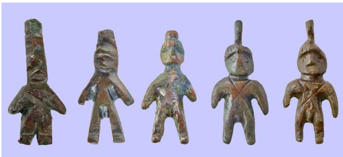
Фрагмент иллюстрации к статье С. В. Язикова, А. В. Тяпухиной «Бронзовые антропоморфные подвески из могильников римского времени Фронтное 3 и Киль-Дере 1 в Юго-Западном Крыму»