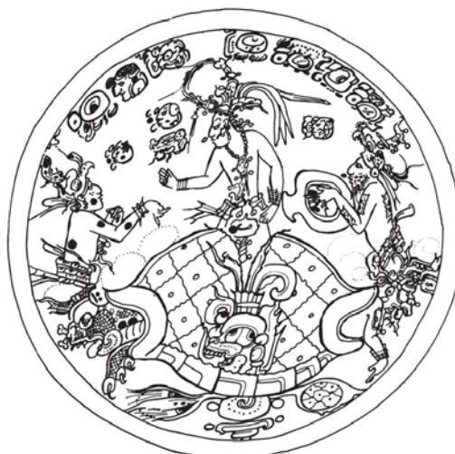
Иллюстрация к статье к статье А.В. Сафронова «Алтарь 1 из Вашактуна (Петен, Гватемала): анализ зооморфного монумента древних майя»: сцена возрождения Бога кукурузы

Статья: Алтарь 1 из Вашактуна (Петен, Гватемала): анализ зооморфного монумента древних майя . Автор: А. В. Сафронов (МГУ им. М.В. Ломоносова).